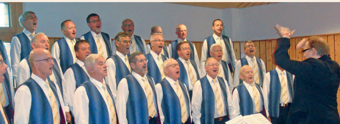
2016: Zentralschweiz, Gesangsfest Cham