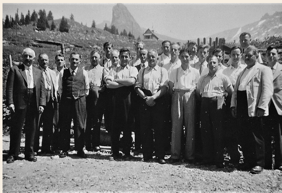
1951: Ausflug auf die Bannalp