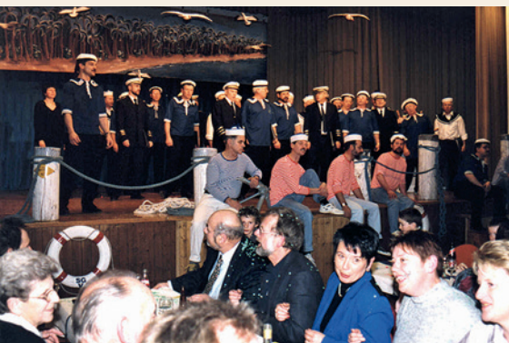
2000: Konzert Seemannslieder